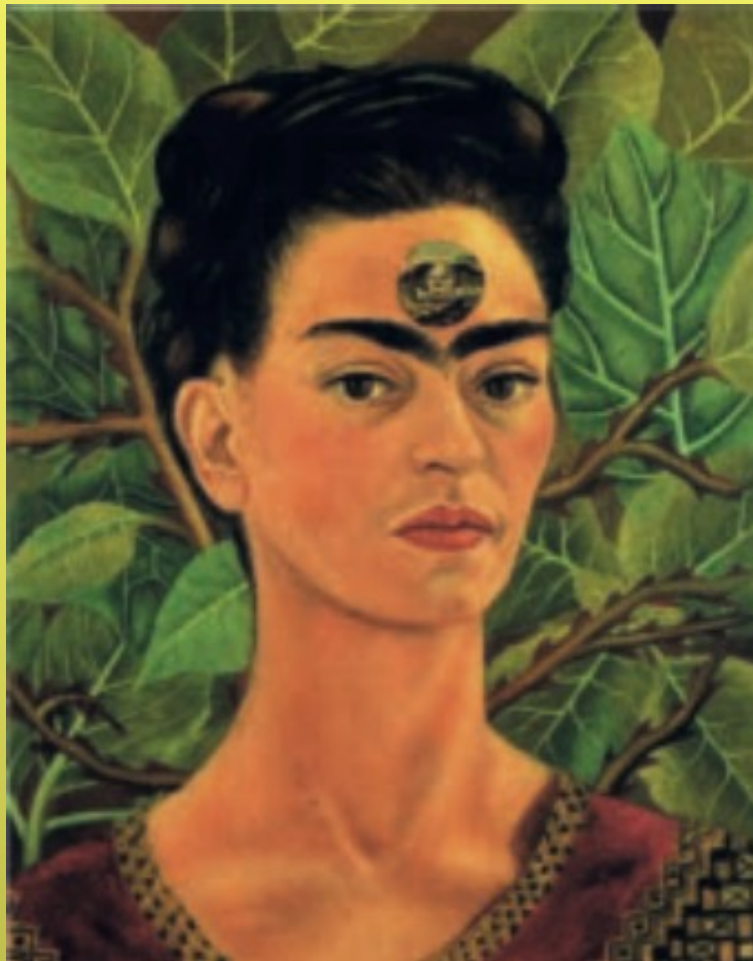
Frida Kahlo, "Pensando alla morte"